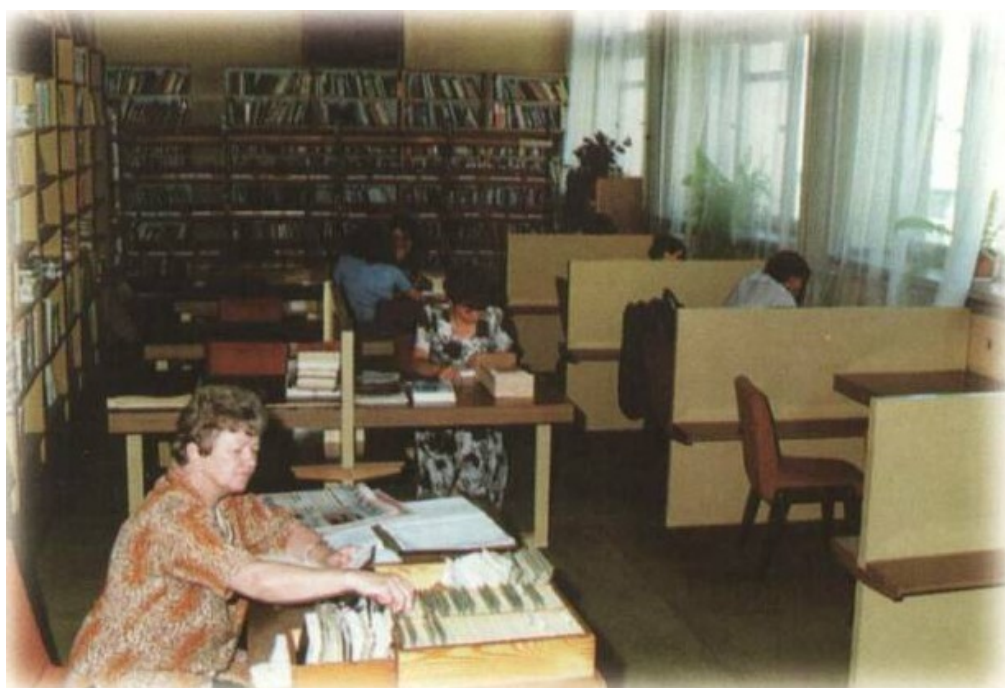
Czytelnia Główna, lata 90. XX wieku