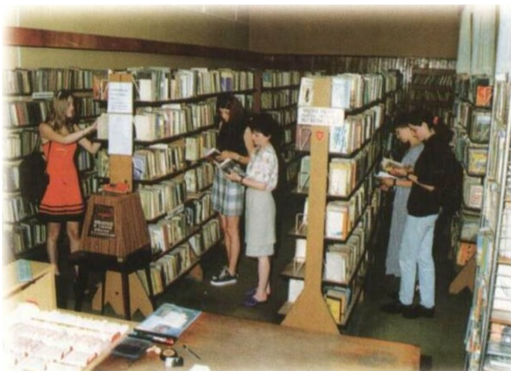
Wypożyczalnia dla Dorosłych