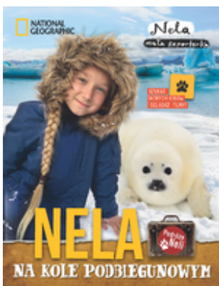
Nela Mała Reporterka

Nela na kole podbiegunowym / Nela Mała Reporterka ; National Geographic. — Warszawa : Burda NG Polska, cop. 2016. — 214, [2] s. : il. kolor. ; 22 cm.