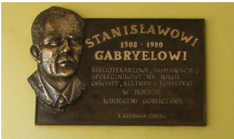
Tablica upamiętniająca nadanie imienia Stanisława Gabryela Miejskiej Bibliotece Publicznej